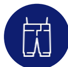
Tiendas de ropa