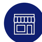
Tiendas de barrio